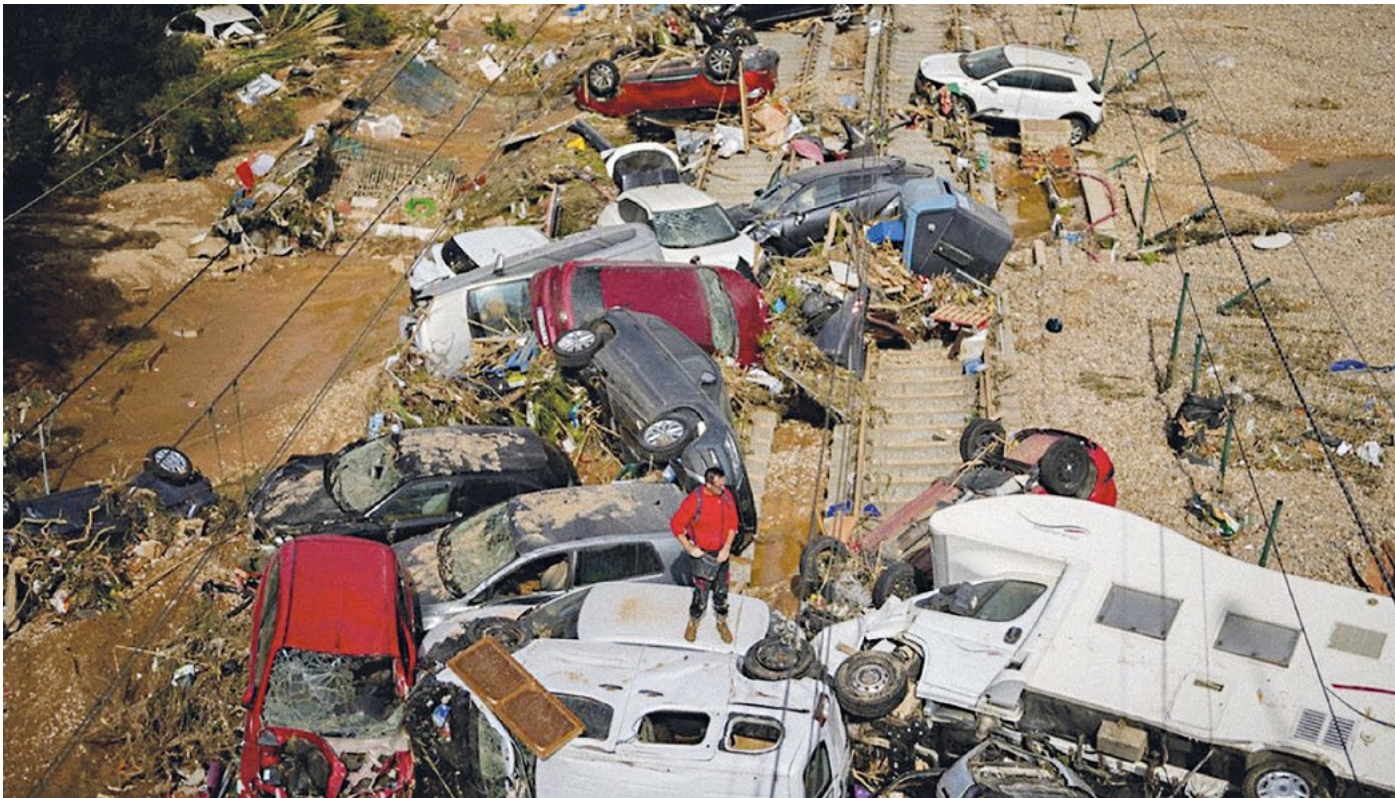
Bild: Valencia 2024 (Foto: The HuT Annual Meeting 2024 Gerzensee, Switzerland, 21th November 2024)

Ein Beispiel für ein derartiges Phänomen erlebte Valencia Ende Oktober 2024. Starkniederschläge sind für diese Region bei weitem keine Seltenheit und Überschwemmungen alle paar Jahre sind die Regel. Am 29. Oktober 2024 sind aber Niederschläge gefallen, wie sie statistisch gesehen nur etwa alle 1000 Jahre vorkommen. Infolge der vorangegangenen, mehrjährigen (und in dieser Intensität ebenfalls aussergewöhnlichen) Trockenheit waren die Böden noch weniger in der Lage als sonst, Niederschläge aufzunehmen. Daraus resultieren Abflüsse, denen in aufwändigen Analysen eine Wiederkehrperiode von 2000 bis 3000 Jahren zugeordnet wurde. Es kamen mindestens 92 Menschen ums Leben, Dutzende werden heute noch vermisst. Die Schäden werden mit über 4 Milliarden Euro beziffert.