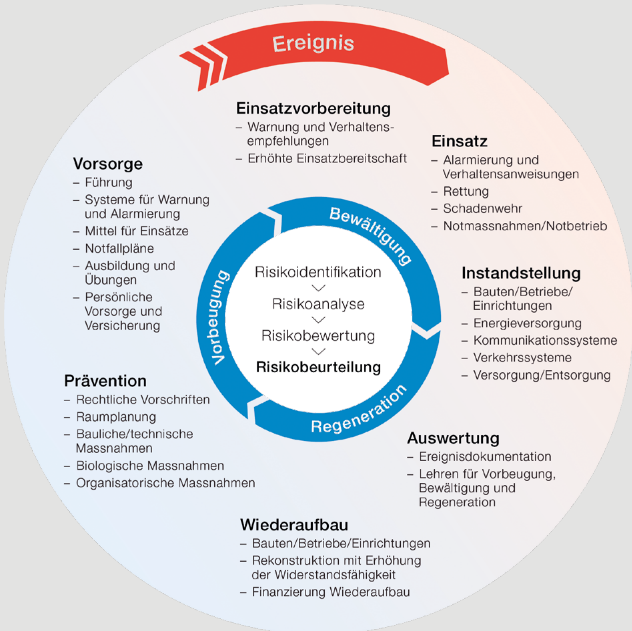
Grafik: Modell des integralen Risiko-managements bei Naturgefahren (Bundesamt für Bevölkerungsschutz BABS)