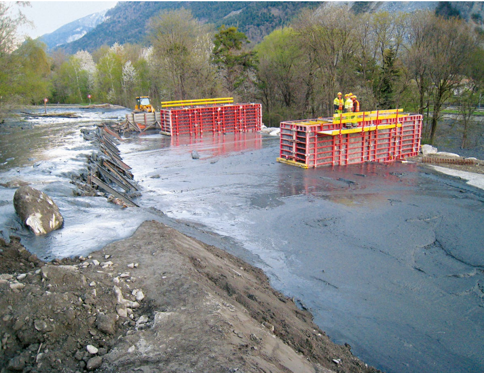
Bild: Val Parghera, 2013, Bau einer Notbrücke: Eine grosse spontane Rutschung verursacht zahlreiche Murgänge, die einen Geschiebesammler überlasten und die Kantonstrasse zwischen Chur und Domat/Ems unterbrechen.