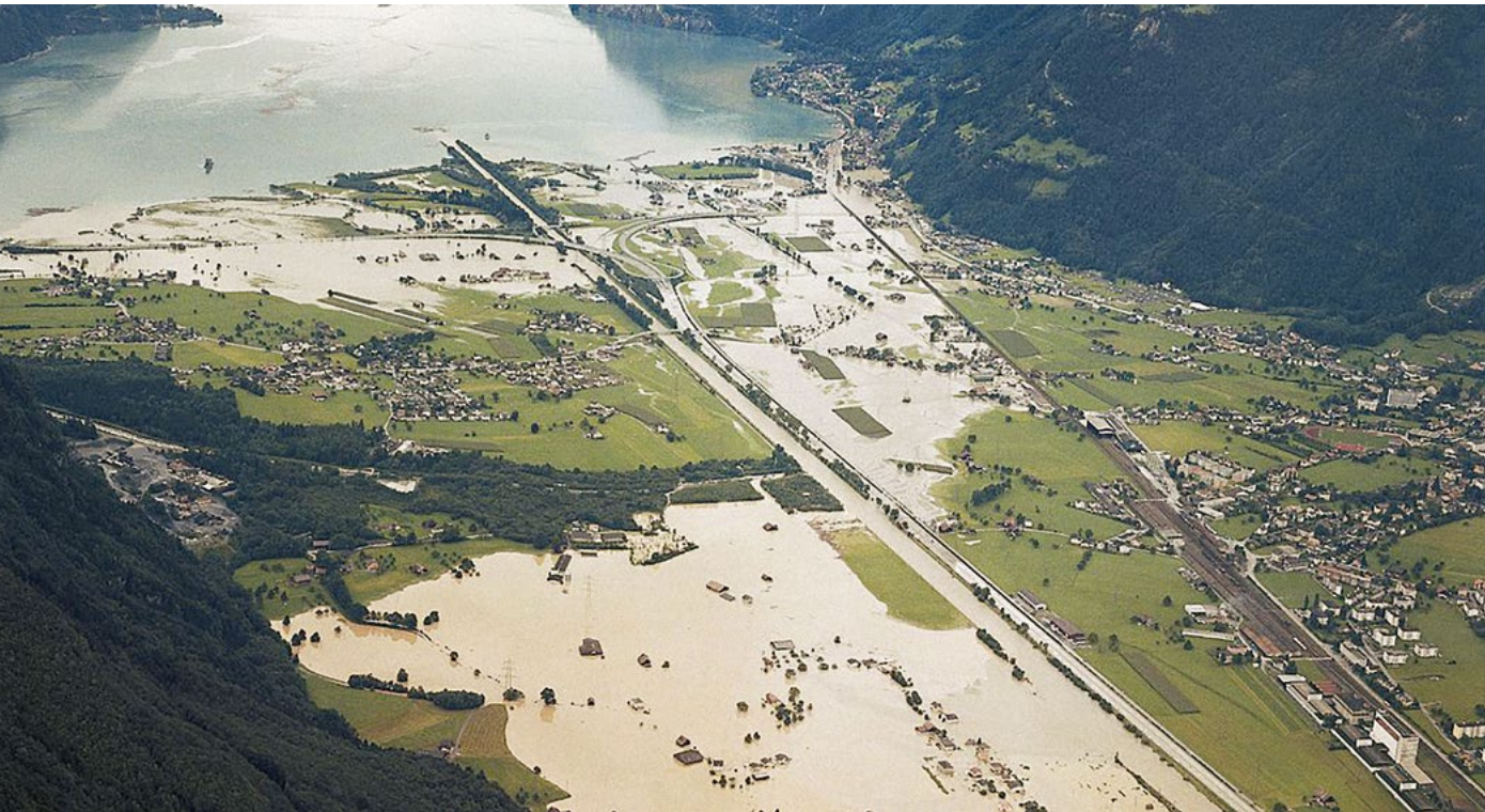
Bild: Die überschwemmte Reussebene vor der Mündung in den Urnersee am 25.8.1987